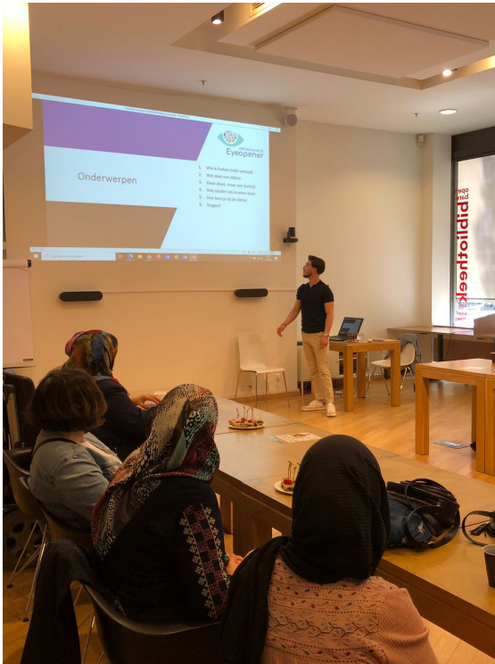
Foto: voorlichting tijdens het Alzheimer Theehuis